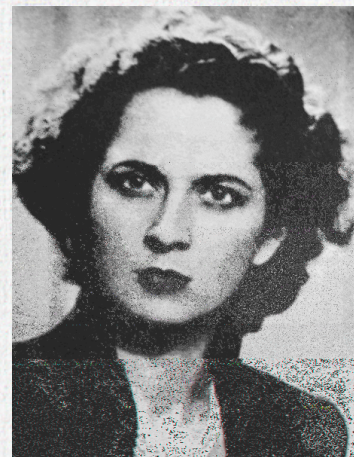
"Narodni heroji Jugoslavije", "Mladost" Beograd 1975. godina.